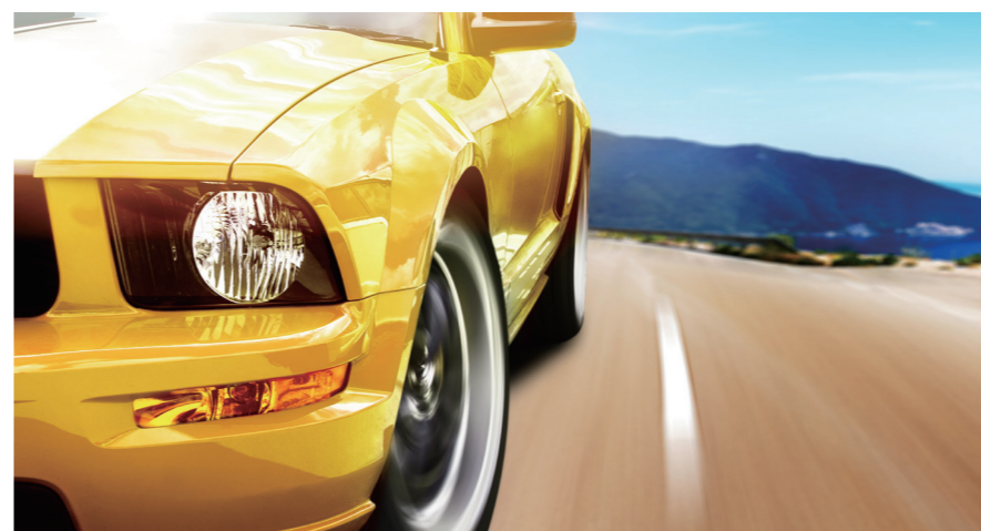
1:1 Customizing Service 주행 환경에 따른 서비스 설계