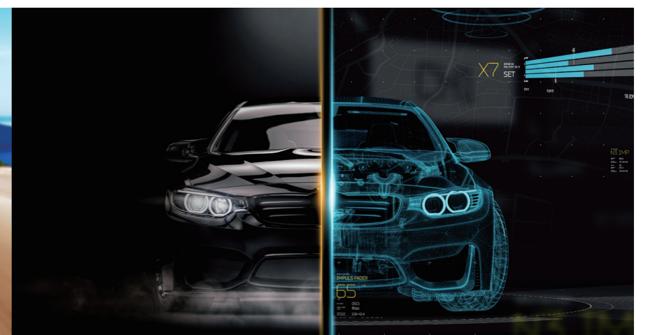
Integrated Managing Service 체계화된 관리 서비스